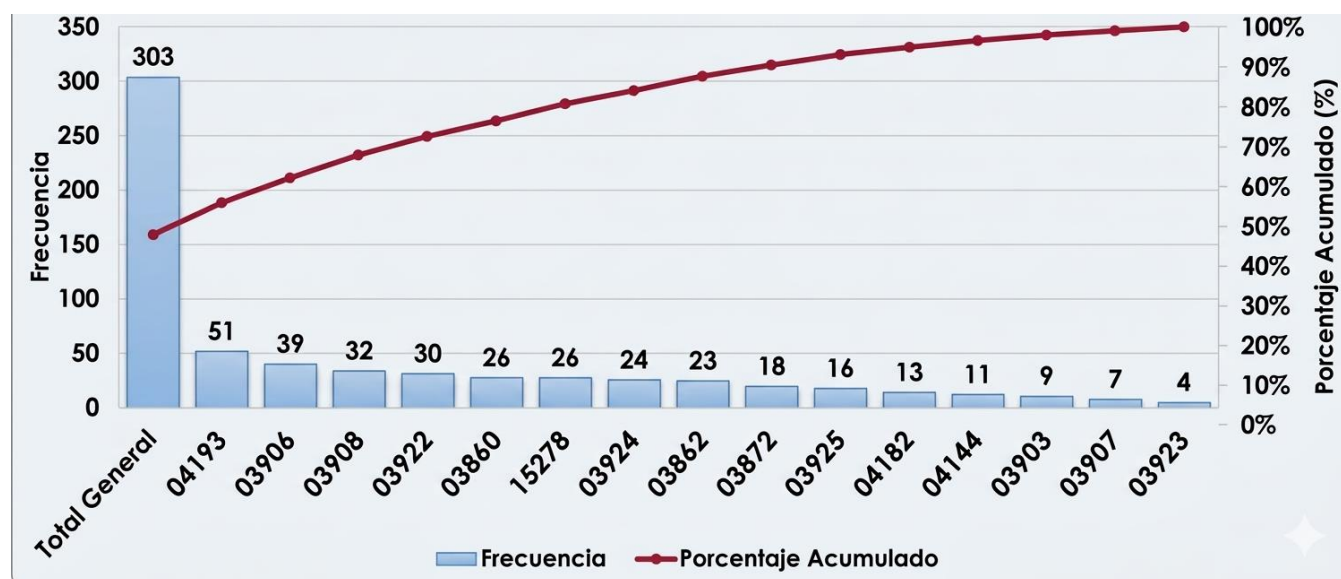
Figura 1. Población y muestra estudiantil por sexo del nivel inicial Municipio Puñal.

La figura 1 muestra la distribución de la población estudiantil del Nivel Inicial en la Seccional de Puñal, desglosada por sexo. En total, se incluyeron 241 estudiantes, de los cuales 127 son varones y 114 son niñas. Los datos recopilados evidencian que las estrategias centradas en el desarrollo del lenguaje oral son ampliamente utilizadas por las docentes. Esta apreciación se corresponde con los hallazgos de la guía de observación, donde se constató una mayor participación verbal en los grupos donde dichas estrategias se implementaban con mayor frecuencia.